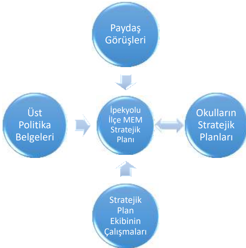
Tablo 3: Sp Plan Oluşum Şeması